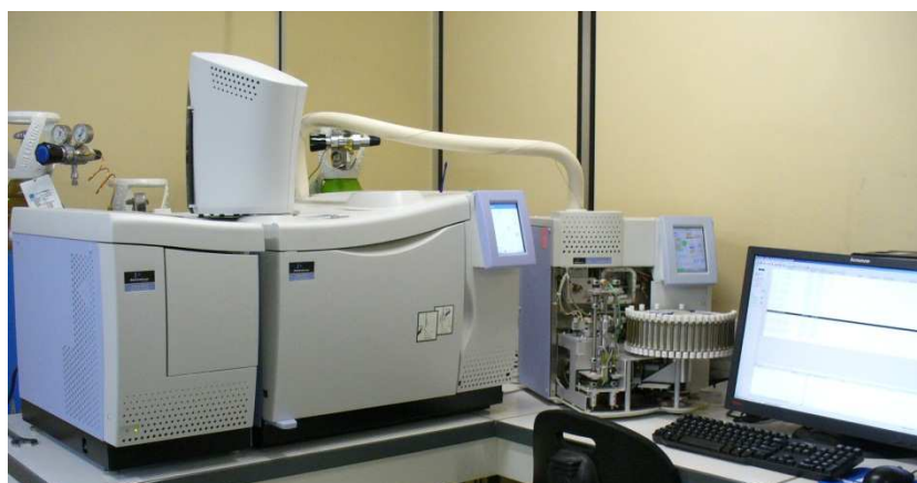
Figure 2 : Photographie du système de Thermodésorption couplé au GC/MS/FID

L'analyse des COV a été effectuée grâce à un thermodésorbeur Perkin Elmer 650 couplé à un GC Clarus 680/ MS Clarus 600C/FID Perkin Elmer selon la norme NF ISO 16000-6. Les tubes ont été chauffés par le thermodésorbeur pendant 30 min à 280°C. Ce chauffage a provoqué une désorption des substances volatiles qui sont alors passées à travers la colonne chromatographique du GC puis ont été détectées par le spectromètre de masse (MS) et FID. Le screening a été réalisé en MS et la quantification en FID en équivalent toluène pour les COV Totaux et en spécifiques pour les différentes molécules.