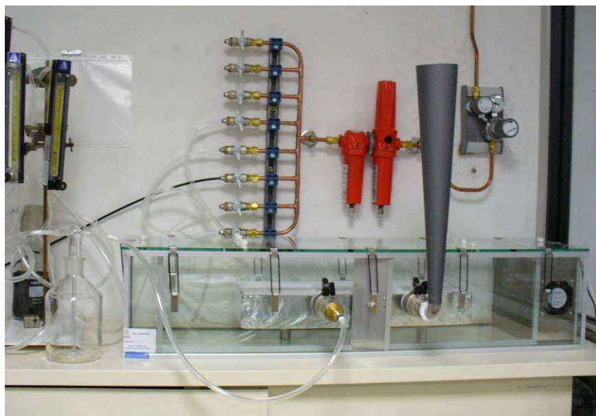
Figure 1 : Chambre d'essai d'émission avec éprouvette

Les bords et le revers de la « Lame Élégance gris iroise finition lisse » ont été calfeutrés avec de l'aluminium et du scotch aluminium non émissif puis l'éprouvette d'essai a été placée en chambre d'essai d'émission en verre propre (Blanc de la chambre réalisé avant).