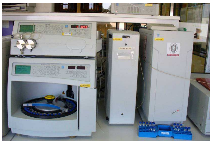
Figure 3 : Photographie du système de chromatographie

Les aldéhydes ont été identifiés et quantifiés par étalonnage spécifique.